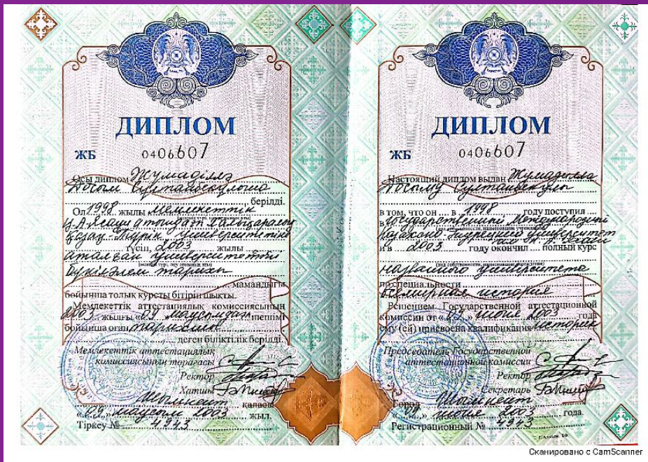
Сканировано с CamScanner